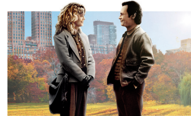
HARRY UND SALLY