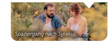
Spaziergang nach Syrakus

DEU 2026, 97 Min Regie: Lars Jessen mit Charly Hübner, Lina Beckmann, Thorsten Merten